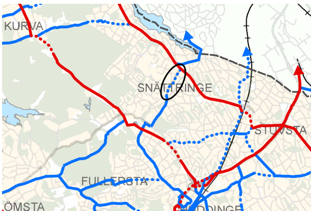
Figur 1. Utpekade cykelstråk i Huddinges cykelplan. Röda länkar utgör regionala cykelstråk, blåa länkar utgör huvudcykelstråk. Saknad länk längs Lönnvägen mellan Ängshydevägen och Häradsvägen inringad i svart.

I Huddinges cykelplan finns ett föreslaget huvudcykelstråk längs Lönnvägen som ska gå från Snättringeleden i söder till kommungränsen mot Stockholm i norr. Mellan Ängshydevägen och Häradsvägen är stråket inte utbyggt i dagsläget, längs denna sträcka finns enbart gångbana (Figur 1).